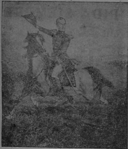
EL LIBERTADOR SIMON BOLIVAR

momentos una aplicación y una inteligencia que lo hicieron a las tir entre sus compañeros. Muy pronto empezó la guerra, y desde luego el General Sucre salió a campaña. Sirvió en las órdenes del General Miranda en los años 11 y 12. Cuando los Generales Maríño, Piar, Bermúdez y Valdez emprendieron la reconquista de su patria, en el año de 13, por la parte oriental, el joven Sucre les acompañó a una empresa la más ardua y temeraria. Apenas un puñado de voluntarios, que no pasaban de ciento, intentaron y lograron la libertad de tres provincias. Sucre siempre se distinguió por su infatigable actividad, por su inteligencia y por su valor. En 14 se celebró en campo raso. El General Sucre era uno de los que se distinguían en medio de estos héroes.