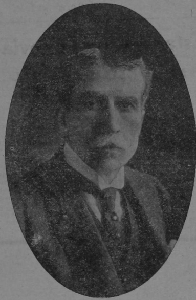
Señor Augusto E. Leguía Presidente del Perú