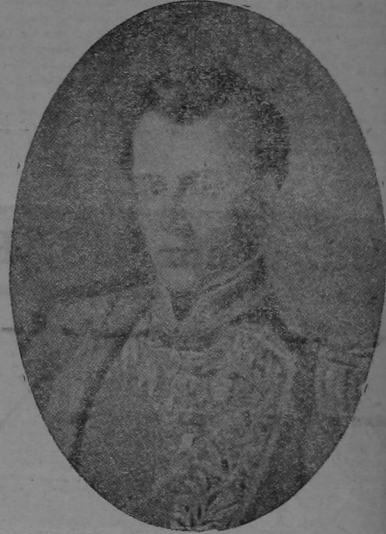
MARISCAL ANTONIO JOSE DE SUCRE

El Gral Sucre sirvió el E. M. G. del Ejército de Oriente desde el año de 1816 hasta el de 1817, siempre con aquel celo, talento y conocimientos que lo han distinguido tanto. Él era el alma del ejército en que servía. Él motivaba todos los dirigidos todo, más, con esa modestia, con esa gracia que con hermosa exactitud ejecuta. En medio de las combustiones que nacen y amatan nacen de la guerra y de la revolución